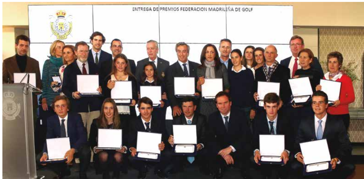
La Federación de Golf de Madrid homenajeó, en un acto en el Club de Golf La Moraleja, a los jugadores que triunfaron a lo largo de 2016, un año pleno de éxitos en el que los madrileños sumaron victorias en casi todas las categorías de los Campeonatos de España, se proclamaron vencedores en los Interautonómicos Femenino y Sub-18 Masculino y además, sumaron siete títulos profesionales en nuestro país y fuera de nuestras fronteras.